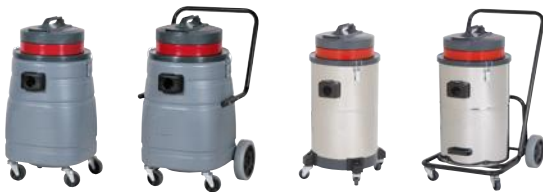
SM 50 B